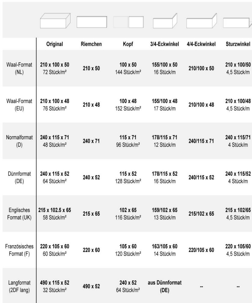
StoCleyer B: zużycie na m 2 według formatu

Sto Sp. z o.o. ul. Zabraniecka 15 PL 03-872 Warszawa Telefon: 022 511 61 00 Telefax: 022 511 61 01 www.sto.pl